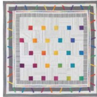
Arc en ciel de lit