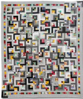
Avant-hier, hier et aujourd'hui