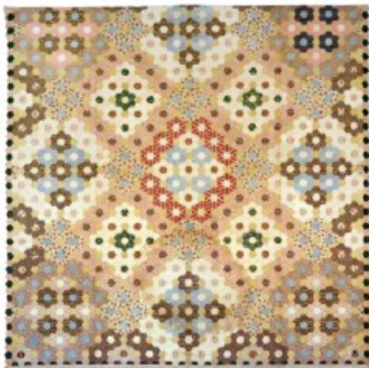
Quilt inachevé d'Akaroa