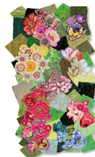
La ronde des chouettes au Val fleuri