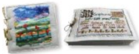
Les livres textiles